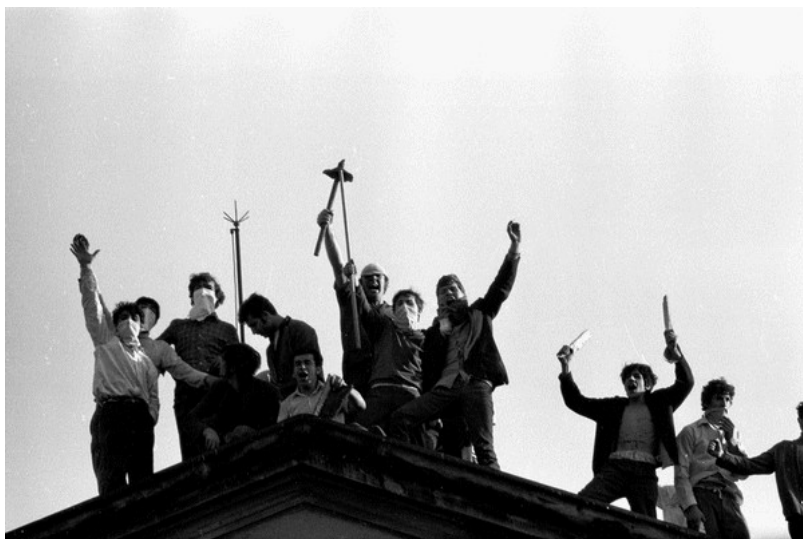
a San Vittore