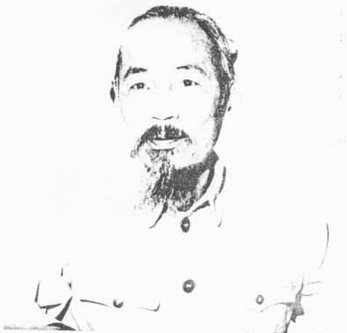
Il suo esempio, la sua vita sono state e rimarranno un incitamento all'azione rivoluzionaria di ogni popolo oppresso e la lotta contro il capitalismo.